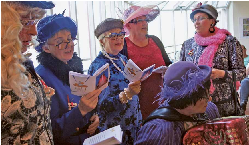
Schnitzelbänke vom Feinsten: Die Gipfältungger in Aktion und...

Kurz nach der Tagwache und dem Hexeneinfall um 06.00 Uhr im Dorf war es auch um die Ruhe im Eyhuis geschehen. Unzählige Hexen und Hexen-Kinder strömten die Eistrasse hinunter. Hungrig vom frühmorgendlichen Treiben war das traditionelle Morgenessen im Eyhuis das Ziel.