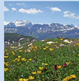
Blick über den Schönbüel in die Berner Alpen.