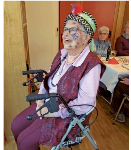
... ihre stolze Mutter.

Auf den Mittag trafen wieder besondere Gäste ein. Die Schnitzelbänkler «Gipfältungger», sechs unermüdliche FasnächtlerInnen aus Giswil, warteten mit einem ausgiebigen Auftritt auf. Mit Melodie und Reim brachten sie viele lustige Neuigkeiten ins Haus. Die BewohnerInnen und die fast 30 Mittagstisch-Gäste würdigten die Gruppe mit einem grossen Applaus.