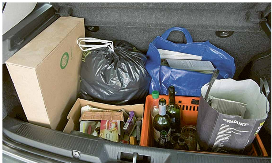
Abfälle sollen korrekt in den entsprechenden Mulden entsorgt werden.

Gemeinsam wollen wir den Kehricht und die Wertstoffe, die im Kanton Obwalden anfallen, sortengerecht entsorgen. Dabei wird der Kehricht in der Kehrichtverbrennungsanlage verbrannt und rezyklierbare Wertstoffe in den Wertstoffkreislauf zurückgeführt, soweit dies ökologisch und ökonomisch sinnvoll ist.