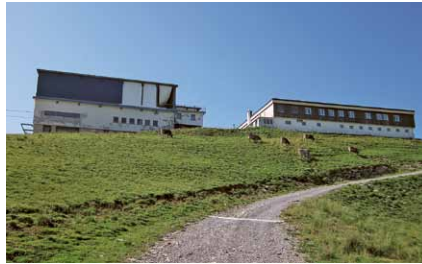
Die Bergstation der Bahn (links) und das Sporting werden noch abgerissen.

An der anschliessenden Teilengemeindeversammlung (Einigtä) wurden die Sachgeschäfte Landtausch/Kauf, Grundegg, Erweiterung Durchfahrtsrecht Parz. 1865,