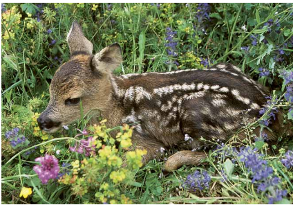
Rehkitz, versteckt in einer Wiese.

Gemeinsam mit Bauern und Bevölkerung möchten wir dies, so gut es geht, verhindern. Wir Lungerner Jäger haben die Rehkitzrettung neu eingeteilt. Wir bitten euch die Liste zu studieren, und mit dem betreffenden Jäger oder Bauer Kontakt aufzunehmen.