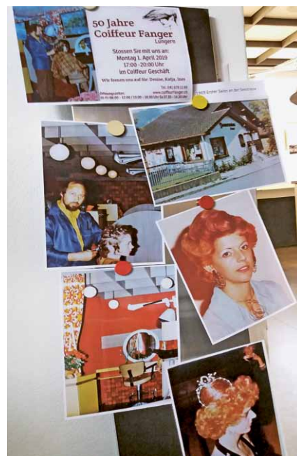
Impressionen zu 50 Jahre Coiffeur Fanger auf der Fotowand.

2019 Am 1. April wird mit einem Apéro auf 50 Jahre Coiffeur Fanger angestossen.