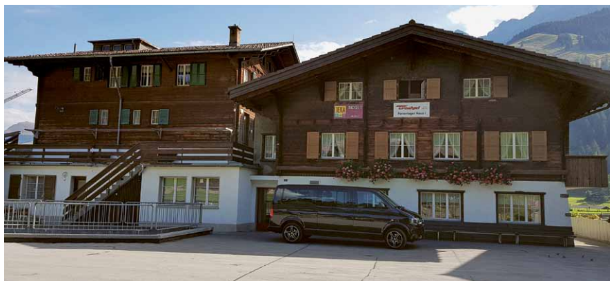
Diese zwei Lagerhäuser werden schon bald voller Lungerner Lagerfreaks sein.

Zur grossen Überraschung wurde der Teilnehmerrekord auch dieses Jahr wieder geknackt. Es haben sich über 95 mutige