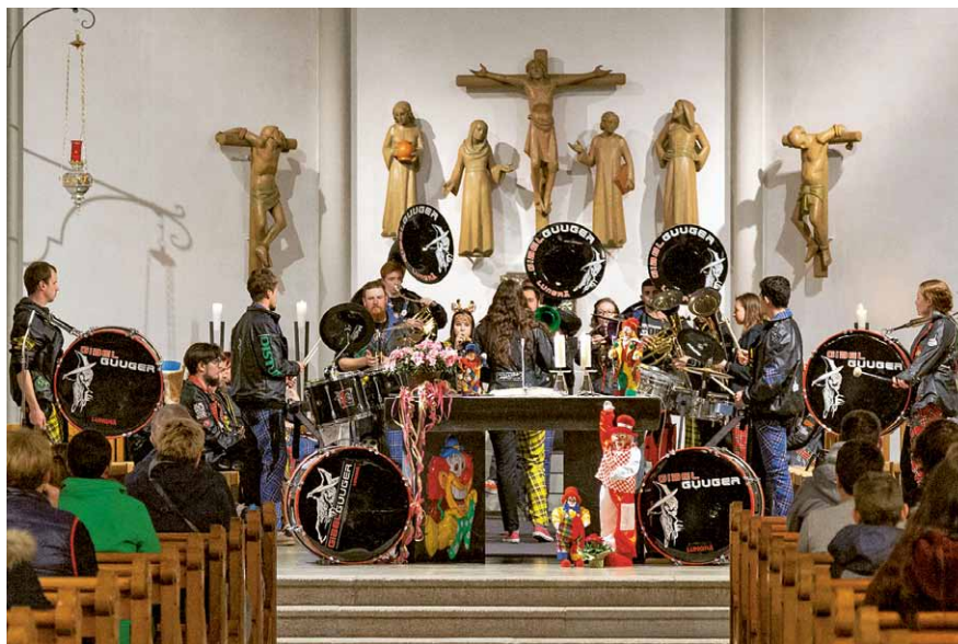
In der Pfarrkirche Lungern wurde ein Fasnachtsgottesdienst gefeiert, welchen auch die Guggenmusik Gibelguuger mitgestaltete.