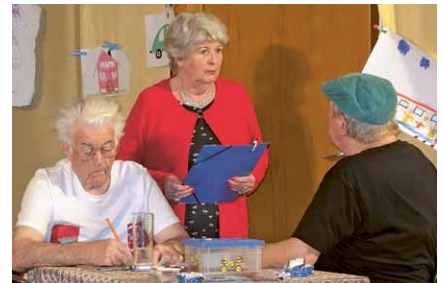
Das Stück enthielt auch ernste Momente.