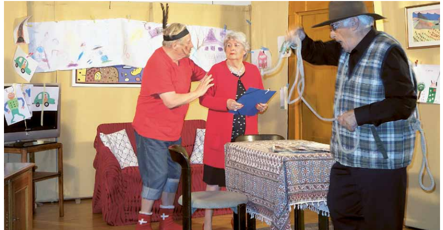
Die Komödie «Bisch sicher?» bot einige turbulente Situationen.

Ab Ende Januar war wieder ganz Lungern im Theaterfieber. Viele Besucher erlebten dieses Jahr wieder eine vielgerühmte Aufführung der Lungerer Theaterlyt. So nutzten auch einige BewohnerInnen vom Eyhuis die Gelegenheit, an einem Sonntagnachmittag in der alten Turnhalle die Komödie um den Hypochonder zu geniessen. Sie waren alle voll des Lobes.