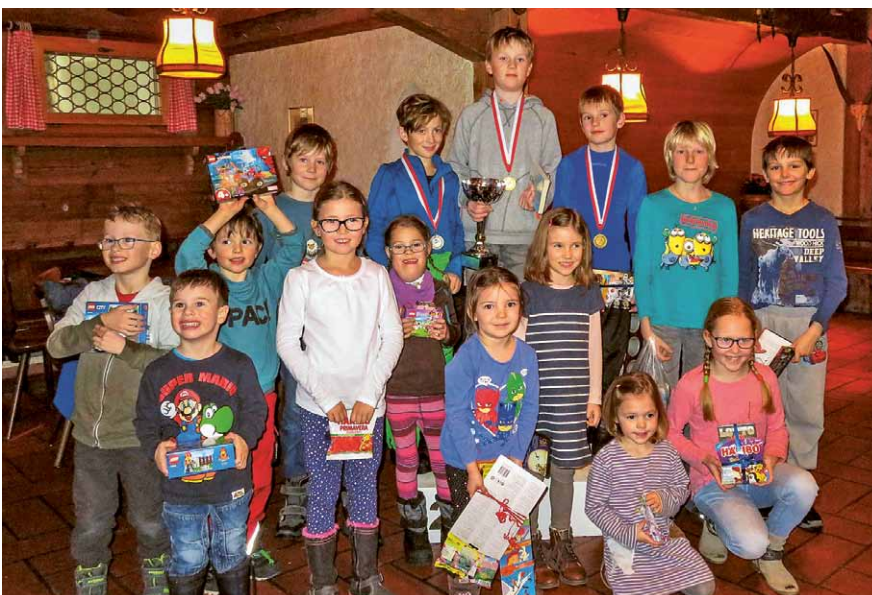
Alle teilnehmenden Kinder konnten sich über ein Geschenk freuen.