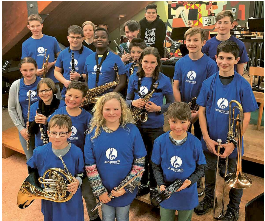
Stolz präsentieren die MusikschülerInnen das neue T-Shirt mit Logo.

Die Aufführungen finden in der Alten Turnhalle, Schulhaus Kamp statt (Eintritt frei, Türkollekte).