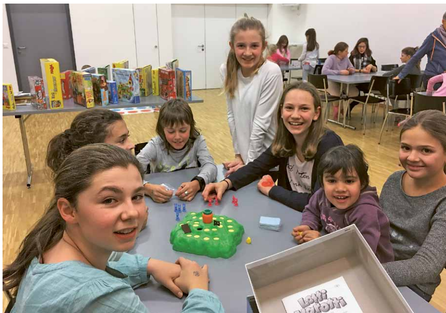
An der Spielnacht waren Gross und Klein dabei.

Zum Glück bleibt den Kindern an der Spielnacht genug Zeit, um viele weitere Spiele auszuprobieren. Auch der Toggelkasten stand bereit und wartete auf nervenaufreibende Matches. Stärkung gab es wie gewohnt am reichhaltigen Kuchen-Hotdog-Popcorn-Bufferet. Hier hatten die Kinder ein weiteres Mal die Qual der Wahl. Schnell verschafften sie sich einen Überblick über das Angebot und das grosse Rechnen begann: «Wie wird das Geld im Portemonnaie angesichts der grossen Auswahl am besten eingesetzt?» Ein/e jeder Mathematiklehrer/in hätte hierbei wohl die hellste Freude verspürt.