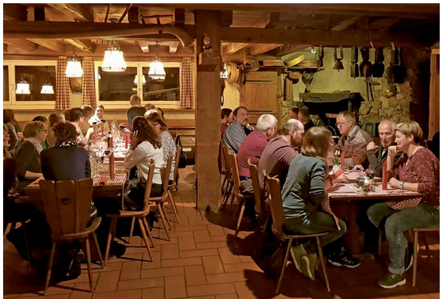
62 Personen folgten der Einladung der Kirchgemeinde Lungern und fanden sich im Alpstubli im Restaurant Bahnhöfli zum Dankesessen ein.