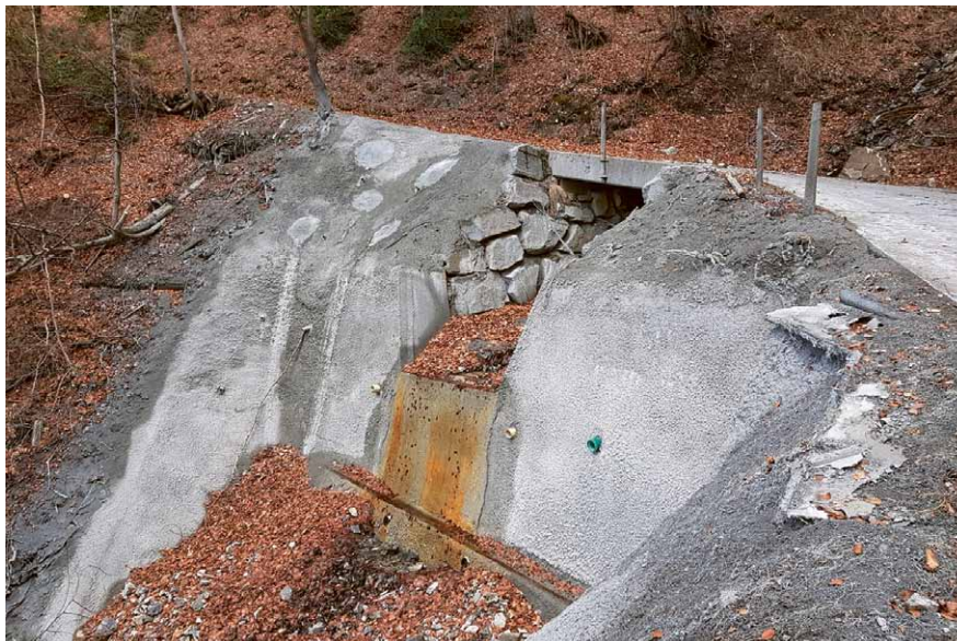
Sanierung der Brunnenmadstrasse im Bereich des Marchgrabens im Jahr 2018.

Dem Antrag des Teilerrates für einen Nachtragskredit von Fr. 35'000.– für den neuen Bewirtschaftungsweg im Feldmoos wurde zugestimmt. Einigerpräsident Beat Gasser begründete die Mehrkosten damit, dass wegen dem Baugrund ein Flies ausgelegt und 500 m 3 Koffermaterial aus dem Klosterald hinaufgeführt werden musste, da