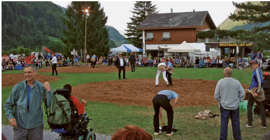
Am 15. Juni 2019 lockt der Biobäschwinget und 28. Abendschwinget wieder mit spannenden Gängen die Schwingerfreunde nach Lungern.

Bei den Aktiven ist es ebenfalls ein Kräfte-messen beidseits des Brünigpasses. Die 60 bis 80 Aktiven aus dem Innerschweizer Verbandsgebiet treten gegen die vier Gastsektionen Schwarzenburg, Meiringen, Hasliberg und Brienz an. Anschwingen ist um 17.30 Uhr geplant. Erfahrungsgemäss setzt sich das Teilnehmerfeld am Abendschwinget vor allem aus Nachwuchsschwingern zusammen. Die Organisatoren hoffen aber auch einige namhafte Athleten begrüßen zu können. Für das leibliche Wohl wird während des ganzen Tages bis in die frühen Morgenstun-