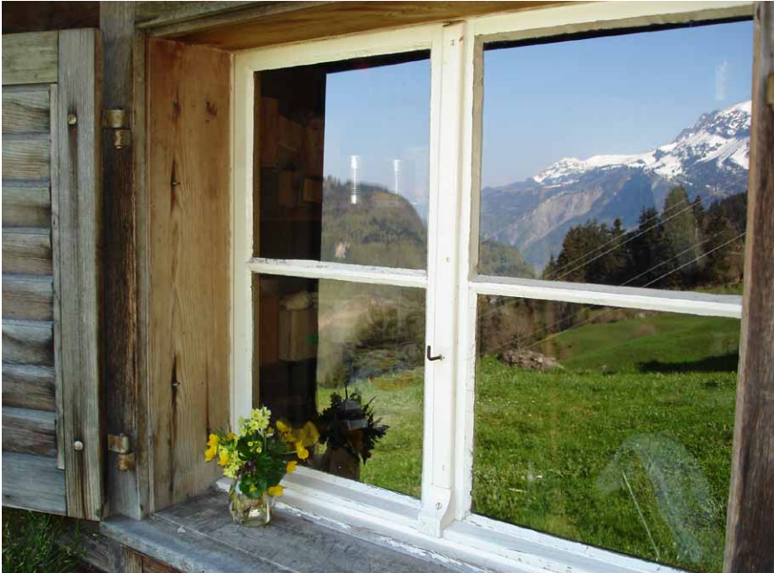
Ist etwa hier der Frühling zu Hause? Mit aller Kraft beginnt es wieder zu gedeihen und der Winter zieht sich immer weiter zurück. Hütte auf Alp Schwendi.