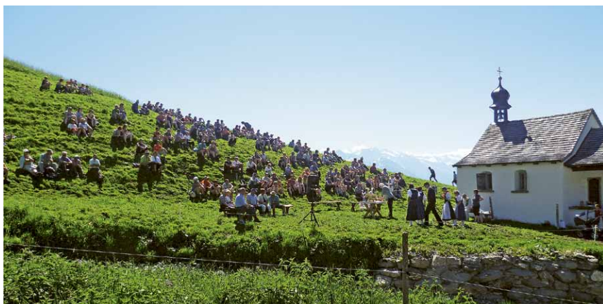
Am 7. Juli 2019 findet das Alpfest Jakob auf der Alp Breitenfeld statt.

8.20 Uhr: Erste Bergfahrt der Lungern-Turren-Bahn 11.00 Uhr: Festgottesdienst mit Alpsegnung anschliessend Älpler-Wahlen anschliessend Festwirtschaft mit musikalischer Unterhaltung 18.00 Uhr: Letzte Talfahrt der Lungern-Turren-Bahn