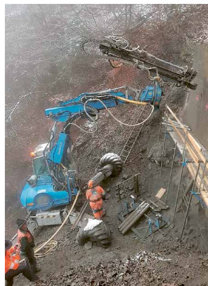
Die Sanierung des unterspülten Fundamentes der Brunnenmadstrasse wurde von der Gasser Felstechnik ausgeführt.